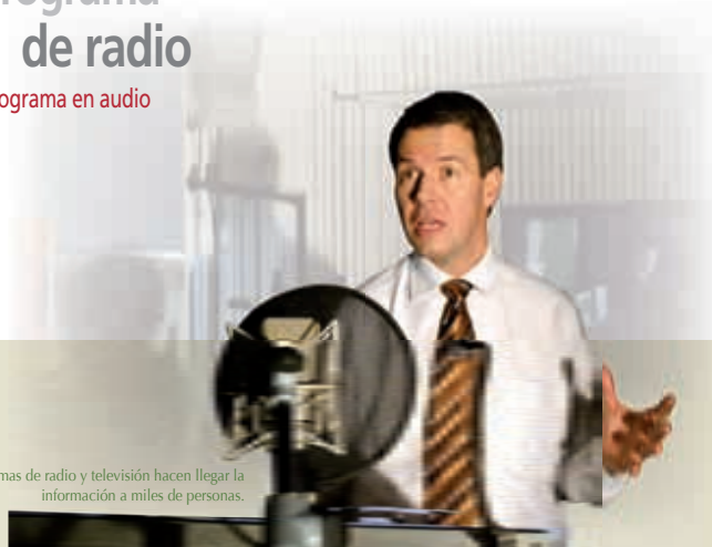
Los programas de radio y televisión hacen llegar la información a miles de personas.

Los medios de comunicación juegan un papel muy importante para la sociedad, pues son el canal de transmisión de todo tipo de información.